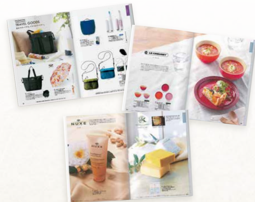
〈カタログ掲載商品の一例〉