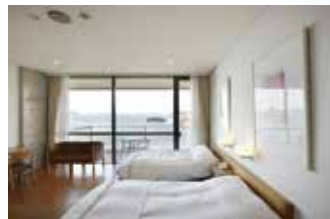
ベネッセハウス ミュージアム 客室