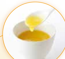
オレンジジュースに