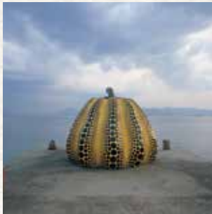
草間彌生「南瓜」

各島でのアート作品や瀬戸内の風景との出会い、地域の人々との触れ合いを通して、訪れてくださるかたがベネッセグループの企業理念である「ベネッセ=よく生きる」とは何かについて考えてくださることを願っています。