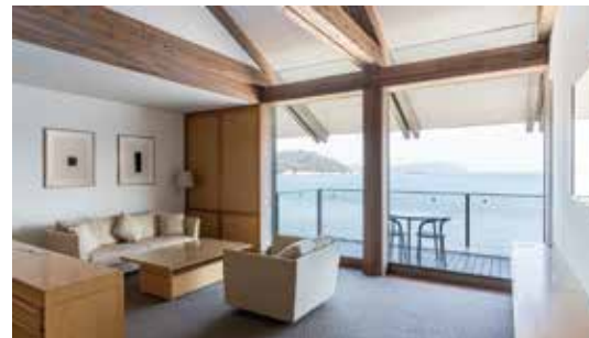
ベネッセハウス ビーチ 客室例(2204号室)