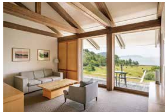
ベネッセハウス パーク 客室例(1201号室)