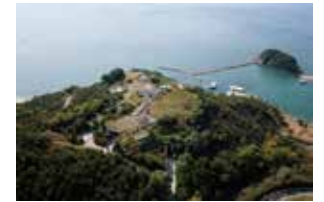
地中美術館

地中美術館は「自然と人間との関係を考える場所」として、2004年に設立されました。瀬戸内の美しい景観を損なわないよう建物の大半が地下に埋設され、館内には、クロード・モネ、ジェームズ・タレル、ウォルター・デ・マリアの作品が安藤忠雄設計の建物に恒久設置されています。地下でありながら自然光が降り注ぎ、一日を通して、また四季を通して作品や空間の表情が刻々と変わります。