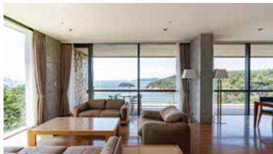
ベネッセハウス ミュージアム 客室例(301号室)