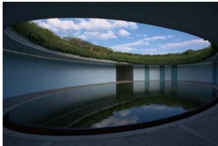
ベネッセハウス オーバル

ベネッセハウスの宿泊優待券(1泊1室分)です。 特別キャンペーンとして、12月から2月は50%割引でご利用いただけます。