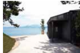
クリスチャン・ボルタンスキー 「心臓音のアーカイブ」

「心臓音のアーカイブ」は、クリスチャン・ボルタンスキーが心臓音を収集するプロジェクトを通じて集めた世界中の人々の心臓音を恒久的に保存し、それらの心臓音を聴くことができる小さな美術館です。自分の心臓音をここで採録することもでき、採録された心臓音は自身のメッセージとともにアーカイブ化され、作品の一部となります。